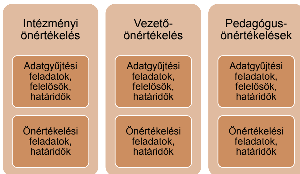
5. sz. ábra. Az éves önértékelési terv ajánlott szerkezete

Az éves önértékelési tervben szereplő határidőket, felelősöket az intézményvezető vagy a nevelőtestület erre kijelölt tagja rögzíti az Oktatási Hivatal által működtetett informatikai felületen, amely a tervben rögzítettnek megfelelően teszi elérhetővé az adatgyűjtő és az értékelő funkciókat az értékelésben részt vevők számára.