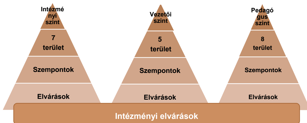
3. sz. ábra. A standard elvárásainak és az intézményi elvárások viszonya

Az általános elvárások értelmezését célszerű két lépésben elvégezni. Az első lépés kiindulópontját a gimnázium dokumentumai (pedagógiai program, vezetői program/pályázat, alapító okirat, SZMSZ, éves munkaterv és beszámolók), és a már működő pedagógus (teljesítmény) értékelési rendszer alkotják, ezeket az adott általános elvárások szempontjából kell megvizsgálni, majd azonosítani az egyes elvárásokhoz kapcsolódó tartalmakat, és ahol azok alapján lehetséges, ott meg is fogalmazható az intézményi értelmezés alapján intézményi elvárás. A második lépés a dokumentumokban nem, vagy csak közvetetten megjelenő elvárások szervezeti szintű értelmezése, ami a gimnáziumban kialakult szokásokra, alkalmazott és bevált gyakorlatokra és módszerekre épül. Ebbe az értelmezési szakaszba már be kell vonni a nevelőtestületet az együtt gondolkodás, a közös elvárások megalkotása és elfogadása igényével.